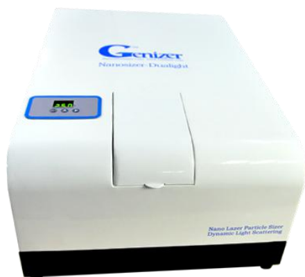
デュアルレーザーナノ粒子 サイズアナライザー