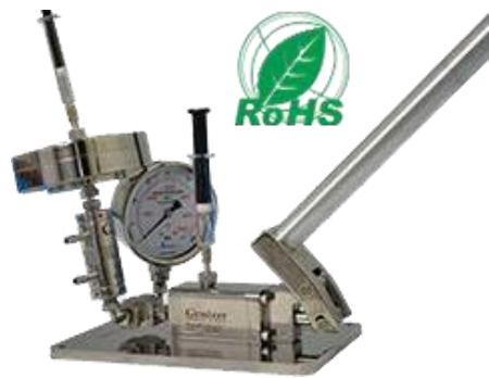
押出機が付くホモジナイザ