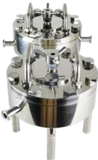
オンライン押出機